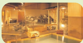
大浴場「水明の湯」 2種類の天然温泉