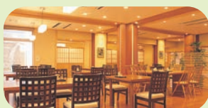
お食事処 ダイニング蓋 (いらか)