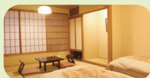
お泊りは和モダンな和洋室の ほかに純和室・洋室タイプも